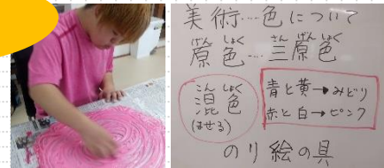
▲原色と混色について学習しました。