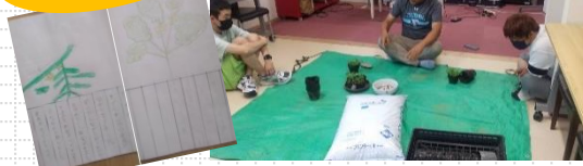
▲土に触れて癒され、植物を育てて豊かな感受性を養います(暑い日は屋内で)