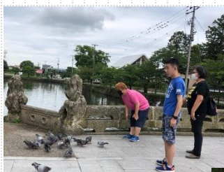
▲米沢に遠征し上杉神社と林泉寺へ。地元の有名店でラーメンを食べました。