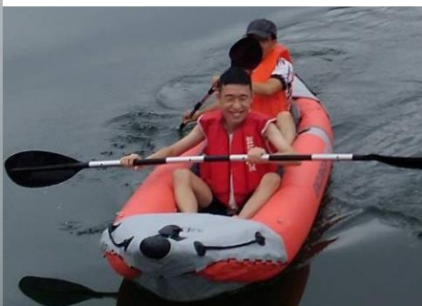
▲ダム湖は「ふくしまの水」の水源にも指定されている美しい水質です。