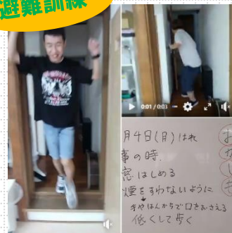
▲いざという時慌てないために。笑ってはいけません(笑)