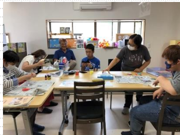
◀牛乳パックで作る貯金箱と、 ▲芳香剤作り。体験の方もいらっやいました。