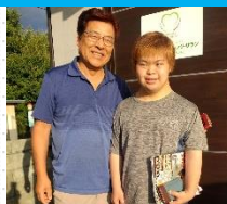
李先生とみずきさん、2人とも髪色が素敵