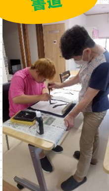
▲きょうの課題は「はらい」でした。