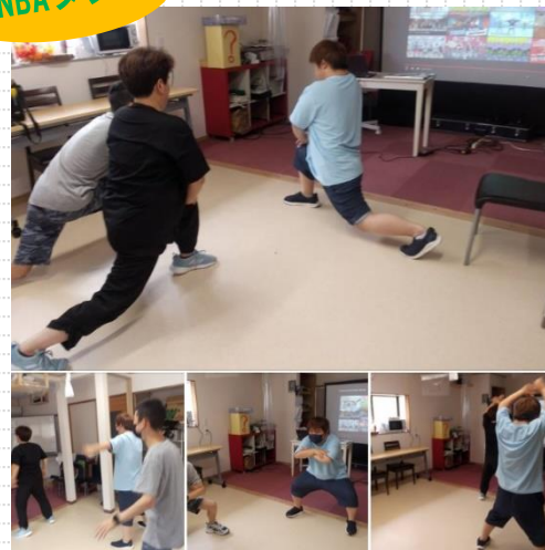
▲はじめてのZUNBAの授業。最初にストレッチ運動をして基本ステップを教わり、ダンシング。気軽にできるエクササイズです。