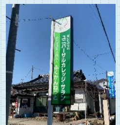
ユニバーサルカレッジ・サラン 2022年 6月予定表