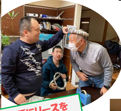
先生の頭にリースをのっけて嬉しそう