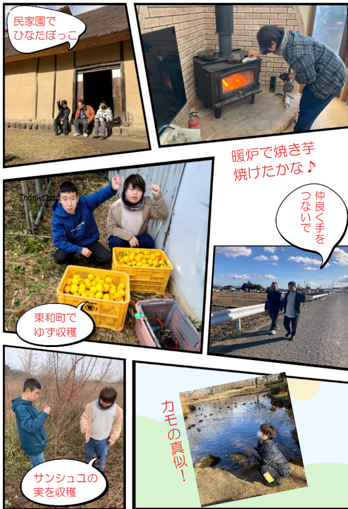
民家園でひなたぼっこ