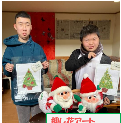
押し花アート こちらクリスマスがテーマ。クリスマスカラーの緑と赤が可愛い。