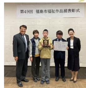
第49回 福島市福祉作品展表彰式