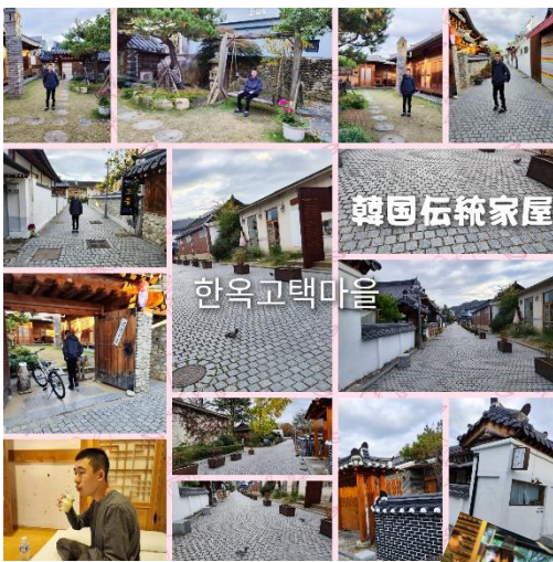
全州韓屋村 韓国文化財をはじめ、韓国グルメやカフェ、土産店等が立ち並んで楽しい！

全州(チョンジュ)そして 群山(クンサン)へ 全州は韓国の伝統が感じられる人気の観光スポットのひとつ。朝鮮王朝の源流とも言われていて、7百棟以上の当時の韓式家屋など韓国生活文化が感じられる歴史的遺産が数多く保存されています。 一方群山は、日本と歴史的つながりが深く多くの日本人が住んでいたことから日本の街並みが当時のままに残されています。