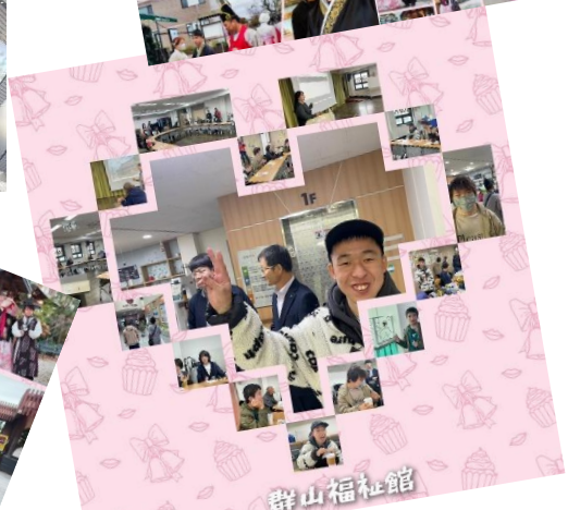
韓国の福祉を学べる 韓国群山福祉館

充実した設備と支援活動の素晴らしさに言葉を失うほど感動！今後私達との連携も約束してくれました。