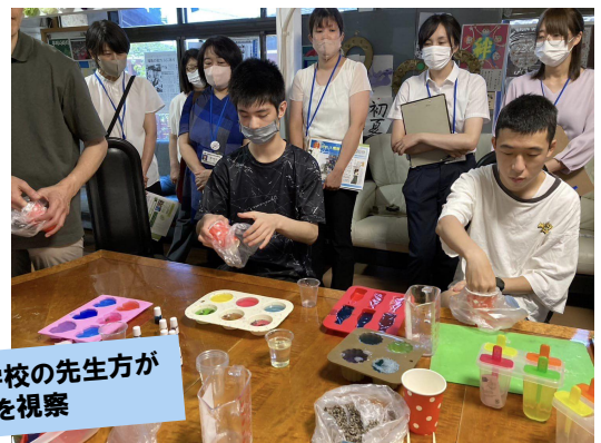
支援学校の先生方が サランを視察