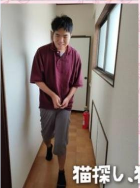
猫探し、猫と一緒に