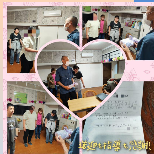
送迎も指導も感謝!