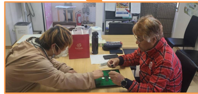
音がぶーんと出るコマ作り