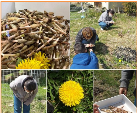
これまで押し花アートの素材は先生からの寄付でしたが、今回は学生自身が採集。つくしがいっぱい採れました