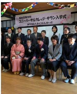
▲昨年3月 入学式の様子