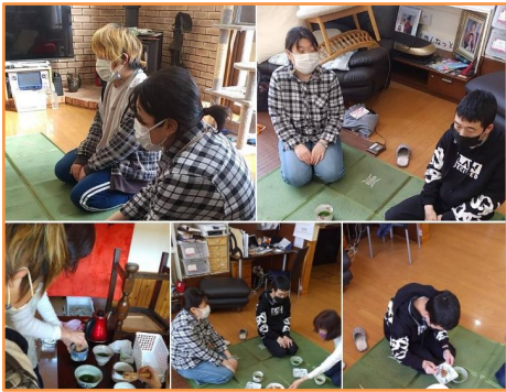
結構なお点前でした