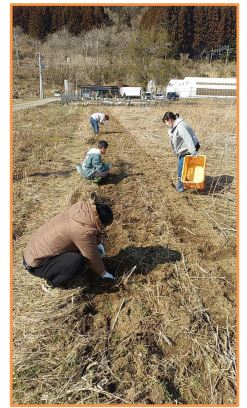
天気の良い日に菊芋拾い澄んだ空気がおいしかった

入学式の映像をYouTubeにアップしていますぜひご覧くださいチャンネル登録をお願いします