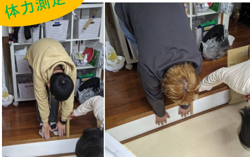
体が柔らかくなった、体重が減った！