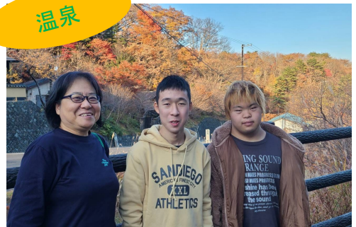
萩原先生が大好きな高湯温泉 良い思い出です