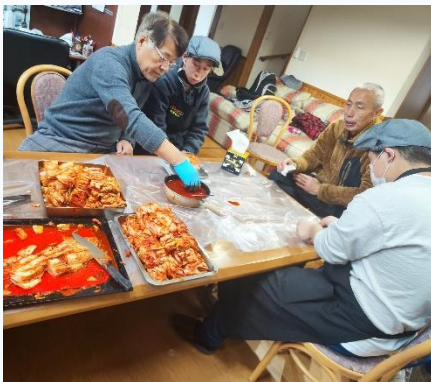
本日の作業はえごまの葉キムチのパック詰めとJAこころへの出荷。支援員のお手本を真剣に見ています。