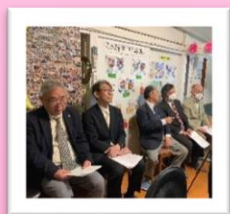
ボランティアご指導のお礼としてささやかながらケーキをお贈りしました。