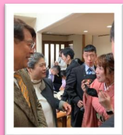
第2部は場所を移動して軽食を召し上がっていただきながらの歓談タイム。みずきさんのダンス、マジック、学生のコーヒーサーブで楽しみました。