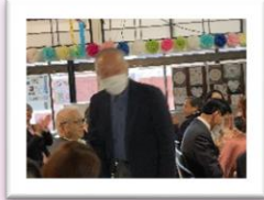
先生方を一人ひとり紹介しました。