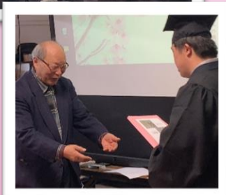
支援員の先生方に2年分のサラン通信をまとめたブックレットを差し上げ感謝の気持ちを伝えました。