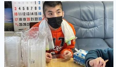
できそうなことから始めよう