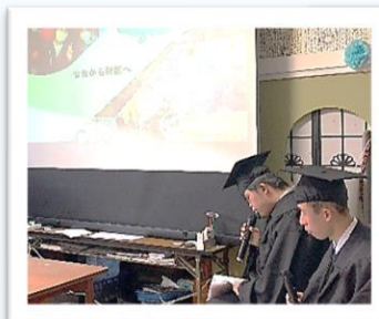
式の進行は自分達で。パワーポイントで作った修学旅行報告は大好評。ユニークなコメントは笑いを取っていました。