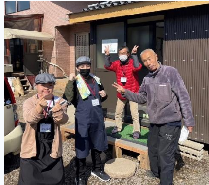
初出勤 よこそ！チングふくしまへ！ ユニフォーム姿がバッチリ決まっています。 ネームプレートも作ってもらいました。